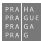
Magistrát HL města Prahy